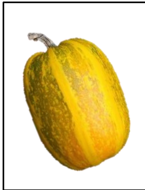
Desenvolvimento da planta